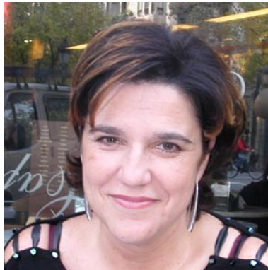
La periodista i escriptora Pilar Rahola és mare adoptiva de dos fills.

La Pilar Rahola ens explica que l'única cosa que funciona és el llenguatge de l'amor. "Que vol dir paciència, sentit de l'humor, no fer transcendent allò que no és transcendent, donar-li temps... perquè cal molt de temps. Però ningú no et preparar perquè el primer petó del teu fill sigui un petó rebutjat, ningú et prepara perquè aquell nen que vols abraçar no vulgui cap abraçada perquè té por de tu" La Pilar ens comenta que no influeixen les experiències anteriors, ja que a l'hora de la veritat és tot un repte. Els adults formen part d'un món que el nen rebutja i alhora necessita. "Al final una gran intuïció, una intuïció que et ve de la terra, de les arrels més profundes t'ajuda a tirar endavant"