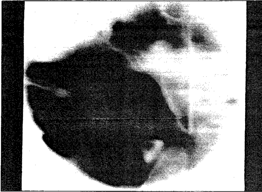
Figura 3. Tomografía de cavum. Se observa con mayor nitidez el aspecto delimitado y redondeado de la tumoración, que ocupa todo el cavum.

morragia que pudiera ocurrir durante la intervención. Se obtuvo una pieza de 3 cm. de diámetro, lisa, pediculada, pardo-cianótica, fibrosa al tacto y muy vascularizada. El estudio anatomopatológico mostró un estroma reticular de tejido conjuntivo con infiltrado celular de eosinófilos y células linfoplasmocitarias con predominio de fibrosis. El diagnóstico fue de «Pólipo inflamatorio».