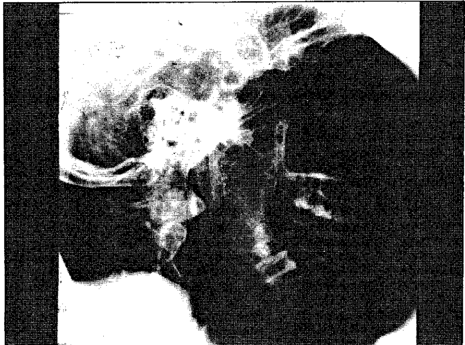
Figura 4. Arteriografía. Tumoración vascular de cavum dependiente del sistema carotídeo externo e interno, sin existir destrucción importante de los vasos.

En la edad pediátrica los tumores de localización nasofaríngea son poco frecuentes. Los pólipos nasosinuales, que en su evolución llegan a traspasar las conchas y crecer en vacum como el pólipo solitario de Killian y el antro-coanal, son los más corrientes. Otros procesos, son raros, pero deben considerarse en el diagnóstico diferencial. Entre los benignos el más ha-