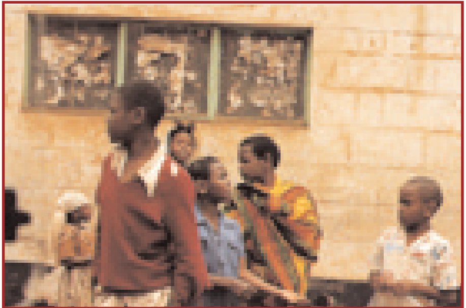
Los problemas psicológicos o de conducta son el doble de frecuentes en estos enfermos crónicos que en otros niños por el stress al que están sometidos.

Para la consecución con éxito de estos tres objetivos básicos de la asis-